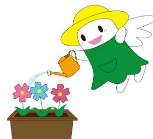
マスコット あるふあん