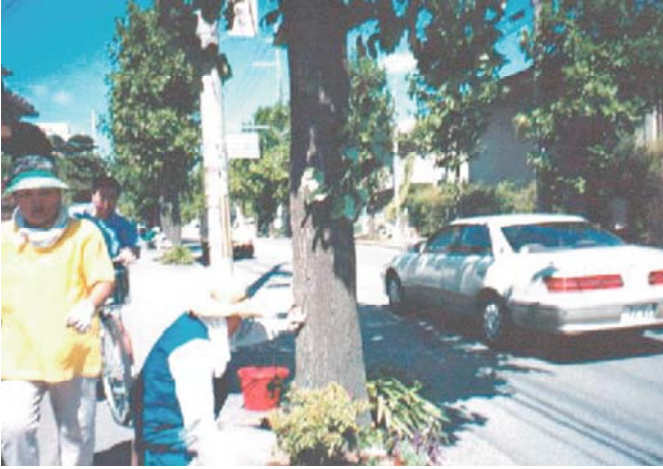
ユリノキ並木の緑化