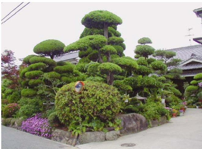
① 植木生産業者の庭園

本課題は、継続して5年間の活動を行ってきた。行政、専門家、広域NPO、地元住民の連携と協働したものである。フリーハンド(内容設定が自由)という特徴を持っている。課題の抽出から、アクションプログラムの策定と実施、その検証までを含めて参加型の活動として設定した。その結果以下の事柄が考察された。