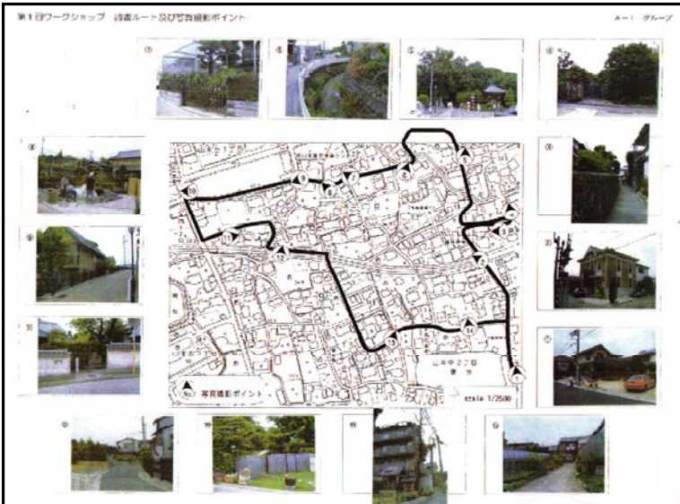
③ 地域住民でまち歩きを行い、良い点、課題を出す