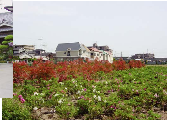
② 守りたい都市の中の緑の圃場