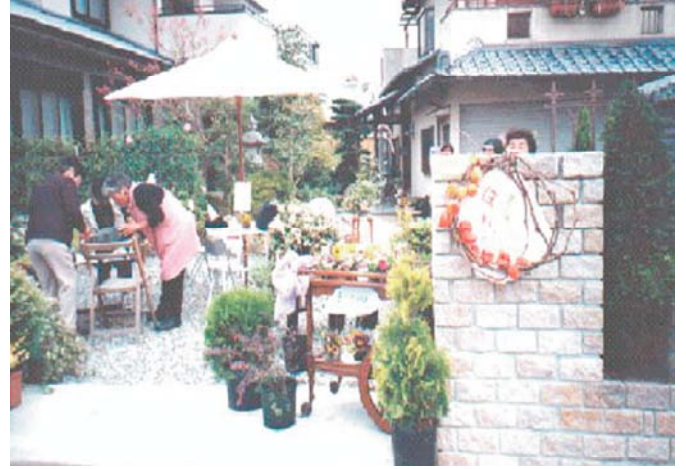
オープンガーデン