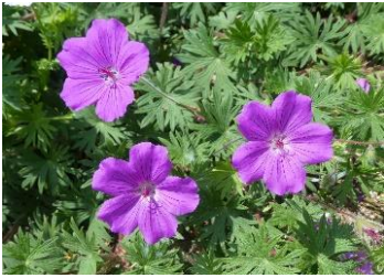
⑳ ゲラニウム ‘タイニーモンスター’ アケボノフウロを基にした園芸品種。