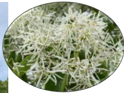
①ヒツバタゴ ナンジャモンジャノキとも呼ばれる。雄株と両性株があり、当校には1本ずつある。