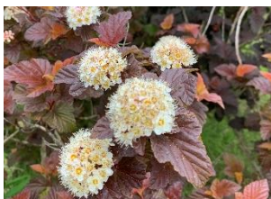
⑯アメリカテマリシモツケ コデマリに似た花。当校には銅葉の品種が3種ある。