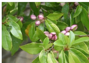
⑰カラタネオガタマ 常緑のモクレンの仲間。花は小さく目立たないがバナナのような良い香りがする。