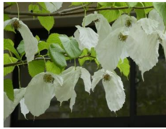
②ハンカチノキ 中国四川、雲南原産。白いハンカチをぶら下げたような花が咲く。上旬まで。