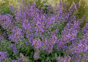
㉔ キャットミント ‘ジュニアウォーカー’ 従来のものよりコンパクトな園芸品種。