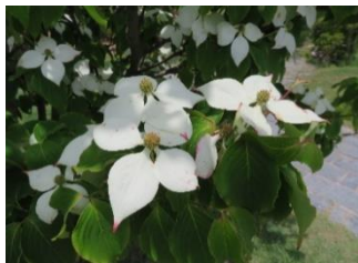
⑧ヤマボウシ 日本の山野に自生する。白い花びらに見えるのは総苞片。