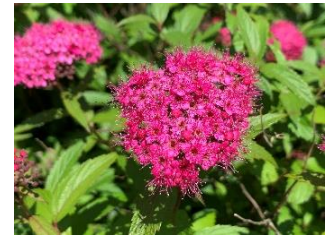
⑦シモツケ 庭木や公園によく使われる低木。白花や源平(赤白)咲などもある。