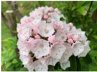
④カルミア 北アメリカ原産のツツジ科の低木。蕾は金平糖やアポロチョコに似た可愛い花。