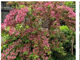
⑨タニウツギ 日本の山野に自生し、田植えの頃に咲く。美しいので庭木にも使われる。