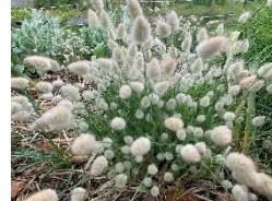
㉚ ラグラス ‘バニーテール’ 兔のしっぽのようにかわいい穂をつける一年草グラス。