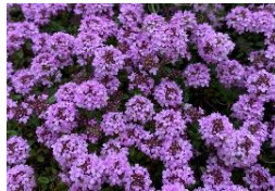
クリーピングタイム