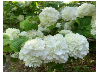
⑥オオデマリ 日本のヤブデマリの手まり咲になった園芸品種。スノーボールとは別種。