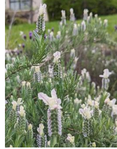
㉗ フレンチラベンダー うさぎの耳のような苞葉が特徴的。