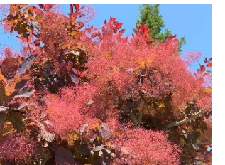
⑬スモークツリー 煙のように見えるのは花ではなく雌花の花柄につく羽毛状の毛。赤、ピンク、白などある。