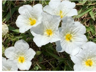
㉑ ギンパイソウ 地面から直接花が出ているような茎の短い花。