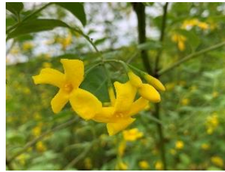
⑤キソケイ ヒマラヤ原産の花木。ジャスミンの仲間だが香りはあまりない。