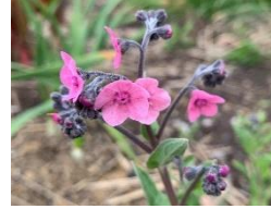
㉙ シノグロッサム ‘メモリーピンク’ ワスレナグサに似た一年草だが大型。