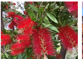
⑫ブラシノキ 花は赤とクリーム色がある。オーストラリア原産の花木。