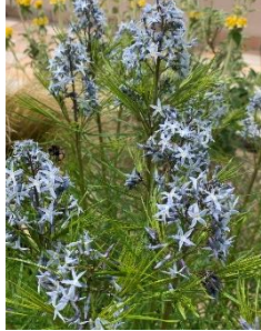
㉕ イトハチョウジソウ 秋の黄葉も美しい。宿根草。