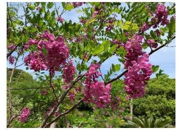
③ハナエンジュ ハリエンジュ(ニセアカシア)の仲間だが、3m程度の低木で花はピンク。