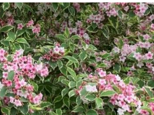
⑩オオベニウツギ‘ハリエガタ’ オオベニウツギの葉に覆輪の入った園芸品種。