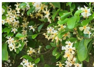
⑱テイカカズラ 日本の山野によく見られるつる性の樹木。キョウチクトウ科で有毒。