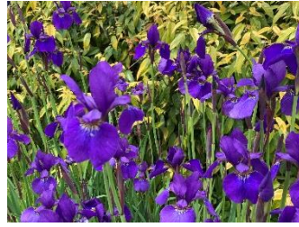
㉒ サキガケアヤメ イリス・シベリカの系統の園芸品種。早咲きで背も高い。