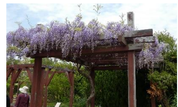
⑲フジ 園芸療法ガーデンに、小さな藤棚があります。