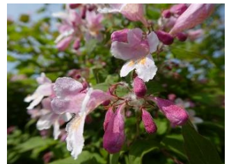
⑪ショウキウツギ 花の柄に白い長い毛があるのを鍾馭の髭にたとえた。