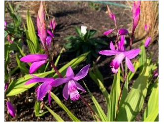
㉓ シラン ラン科には珍しく丈夫でよく増える宿根草。