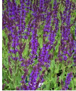
㉖ サルビア・ネモローサ ‘カラドンナ’ 花もちの良い宿根草。