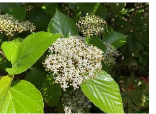
⑭ハクサンボク 主に西日本の林地に自生する常緑花木。秋には赤い実が美しい。