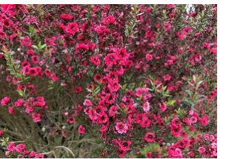
⑮ギョリュウバイ オーストラリア・NZ原産の花木。マヌカハニーの蜜源。