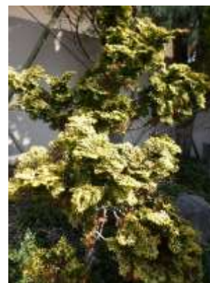
ヒノキ 'ナナルテア'