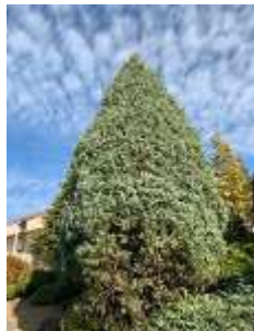
アリゾナイトスギ 'ブルーアイス'

コニファーは松ぼっくりのような球果(cone コーン)をつける植物というのと、樹形が円錐状(Conical)になる樹木というところから、主に針葉樹をさします。しかし、林業のヒノキやスギなどは園芸としては含めず、針葉樹の中で、葉色や樹形が美しく観賞の対象になる、比較的小コンパクトなものということでいいと思います。コニファーの品種は500以上あり、よく似た品種が多く、ラベルがなくなると同定は難しくなります。