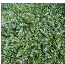
ハイネズ 'ブルーパシフィック'