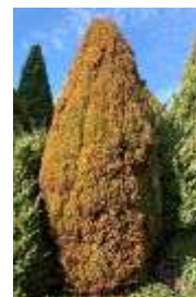
コノテガシワ 'ローズダリス'