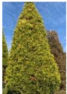
レイランドヒノキ 'ゴールドライダー'