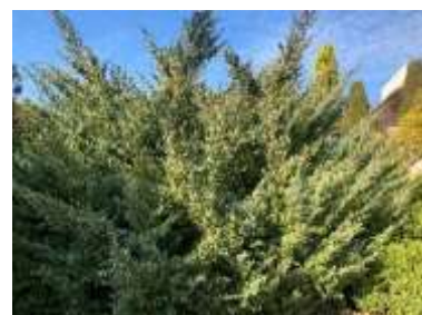
エンピツビャクシン 'グレイオール'