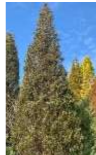
コロラドビャクシン 'ブルーヘブン'