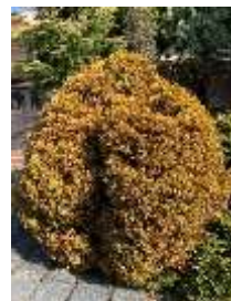
ニオイヒバ 'ラインゴールド'