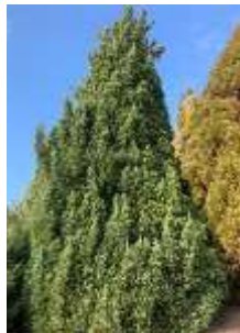
カイヅカイブキ 'ブルーポイント'