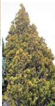
コノテガシワ 'エレガントシマ'