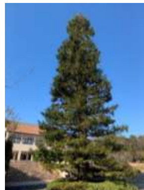
⑪センペルセコイア ガーデンのシンボルツリー