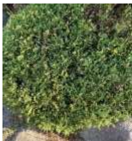
コウアンビャクシン 'エクспанサ オーレオバリエガータ'