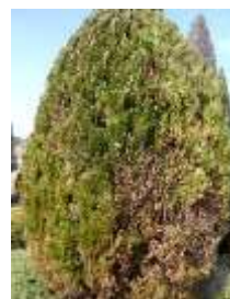
コノテガシワ 'センジュ'