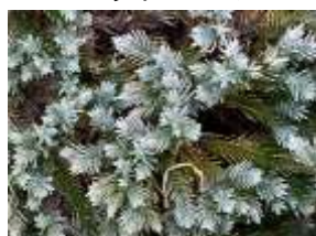
ニイタカビャクシン 'ブルースター'