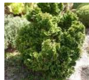
ヒノキ 'ナナグラシリス'