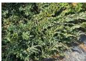
ニイタカビャクシン 'ブルーカーペット'