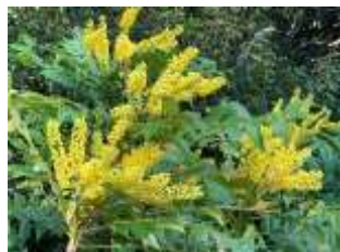
⑨セイヨウヒラギナンテン ‘チャリティー’ ヒラギナンテンの交雑品種