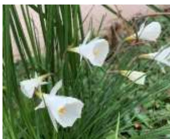
⑬ナルキッス・ カンタブリスク スペイン原産の原種系で早咲き