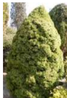
カナダトウヒ 'コニガ'