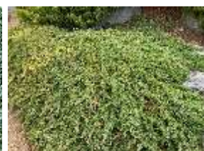
ハイビャクシン '八房ソナレ'