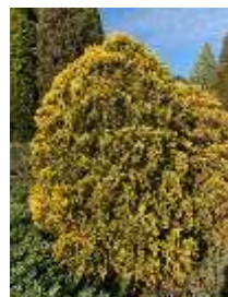
ニオイヒバ 'サンキスト'