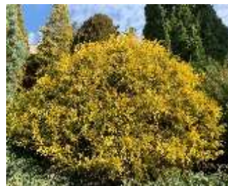
サワラ 'フィリフェラオーレア'