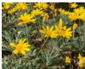
⑩ユリオプスデージー 南アフリカ原産の常緑亜低木