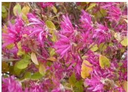
⑤ベニバトキワマンサク 垣根にも使われる