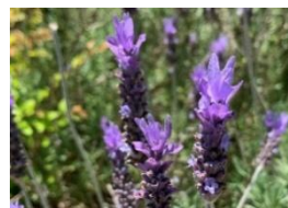
⑪フリンジラベンダー 葉に歯のような刻みか があるのが特徴