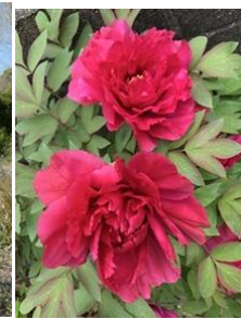
⑰ポタン 百花の王と言われる