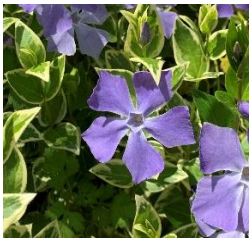
★ツルニチニチソウ 各所にみられる。つるでよく増える