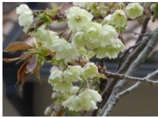
④サトザクラ‘鬱金’ 淡黄色の桜