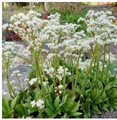
⑮タンチョウソウ アルパインロックガーデンにある