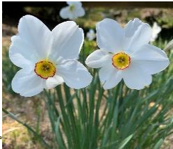
★スイセン各種 1月頃から咲くニホンスイセンが咲き終わったら、大杯スイセン、ラッパスイセン、クチベニスイセンなど様々な品種が各所で咲き変わる