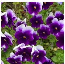
パンジー・ビオラ

カラーガーデンの花壇や園芸療法ガーデンには季節の一年草が植えられている。年によって種類は変わる。