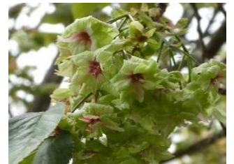
④サトザクラ‘御衣黄’ 緑花の桜