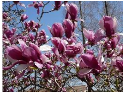
ピッカーズルビー