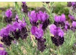
⑩フレンチラベンダー うさぎの耳のような苞葉が 特徴的