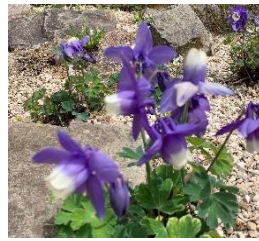
⑮ミヤマオダマキ アルパインロックガーデンにある