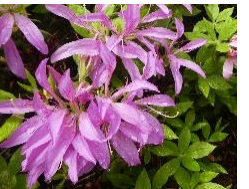
⑧モチソウジ‘花車’ 花卉が根元まで切れ込 んだ園芸品種