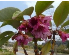
⑨ロドレイヤ 和名シャクナゲモドキ 4月中旬頃まで