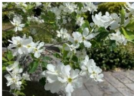
⑥リキュウバイ 中国原産。茶花によく使われる