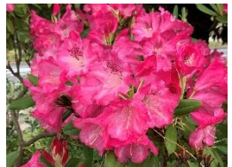
⑦セイヨウシャクナゲ 当園には濃桃、ピンク、 など数種類ある