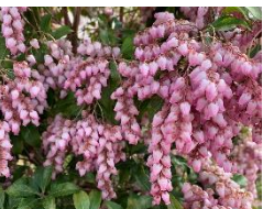
⑬アケボノアセビ アセビのピンク色の品種