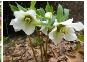
★クリスマスローズ各種