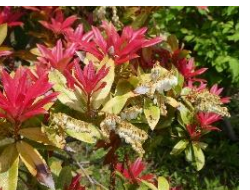
⑭タイワンアセビ 赤い新葉が花のように 目立つ