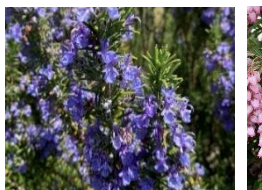
⑫ローズマリー 葉に強い香りがある 有名なハーブ