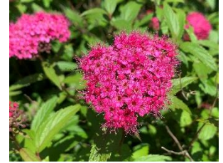
⑬シモツケ 庭木や公園によく使われる低木。白花や源平(赤白)咲きなどもある。写真は濃色品種。