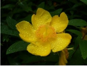
⑭ヒペリカム ヒドコート オトギリソウ科の低木で大輪キンシバイとも言う。中国原産の園芸種。