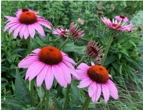
⑯エキナセア 夏の宿根草の代表。花後の実(シードヘッド)も楽しめる。市道沿いに複数種ある。