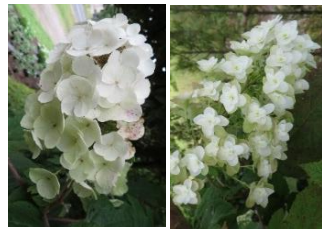
⑪カシワバアジサイ アメリカ原産のアジサイ。葉がカシワの葉に似た形で、花がピラミッド状に咲く。一重咲き・八重咲きがある