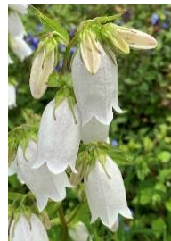
⑱ホタルブクロ この花に蛍をいれて遊んだ。