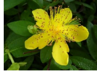
⑮ヒペリカム カリシナム オトギリソウ科の低木で、セイウキンシバイとも言う。