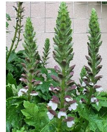
⑰アカンサスモリス 大型の存在感ある宿根草。