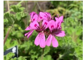
⑰ローズゼラニウム 葉にローズの香り