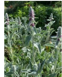
⑳ラムズイヤ 葉の手触りが気持ちよい。