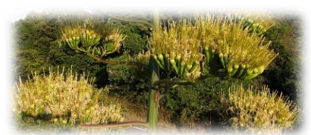
過去に咲いた花 8月頃