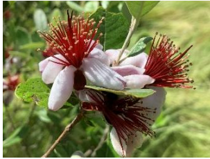
⑩フェイジョア 中南米原産の果樹ですが、姿や花も美しく、暖地では庭木として使える。