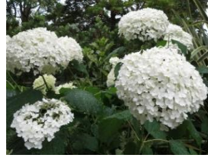
⑫アナベル アメリカ原産のアメリカノリノキの手まり咲き品種。管理が容易なので近年人気。