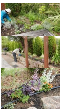
触れる花壇・色の花壇 1班