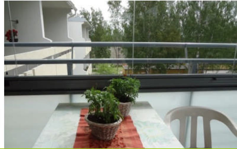
テラスから各部屋のベランダが見える