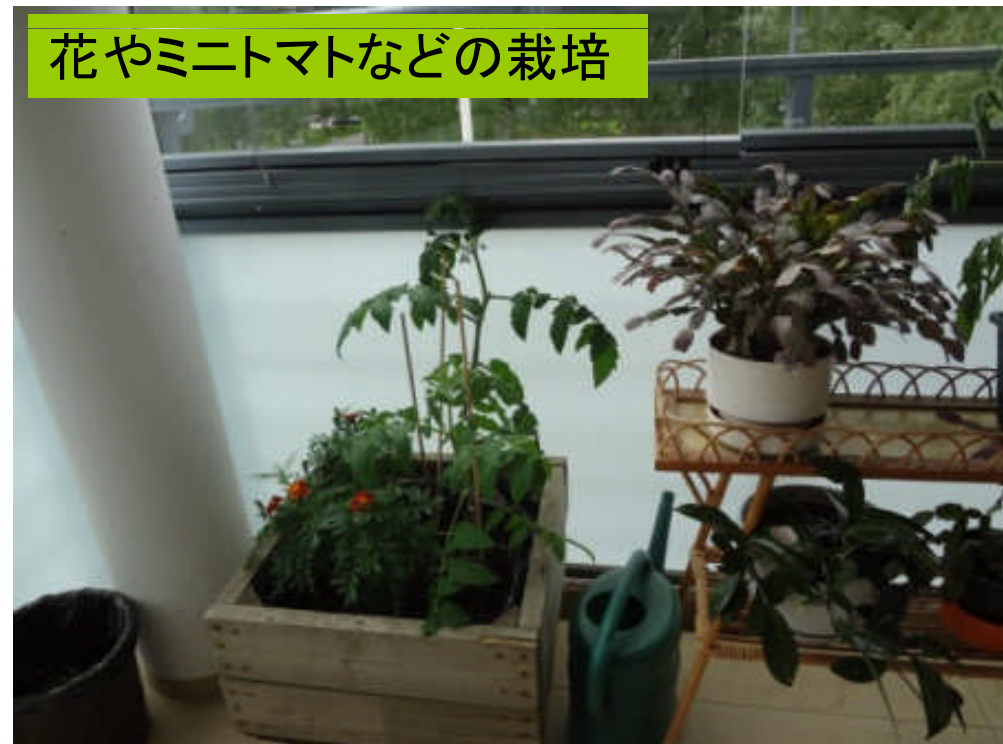
花やミニトマトなどの栽培