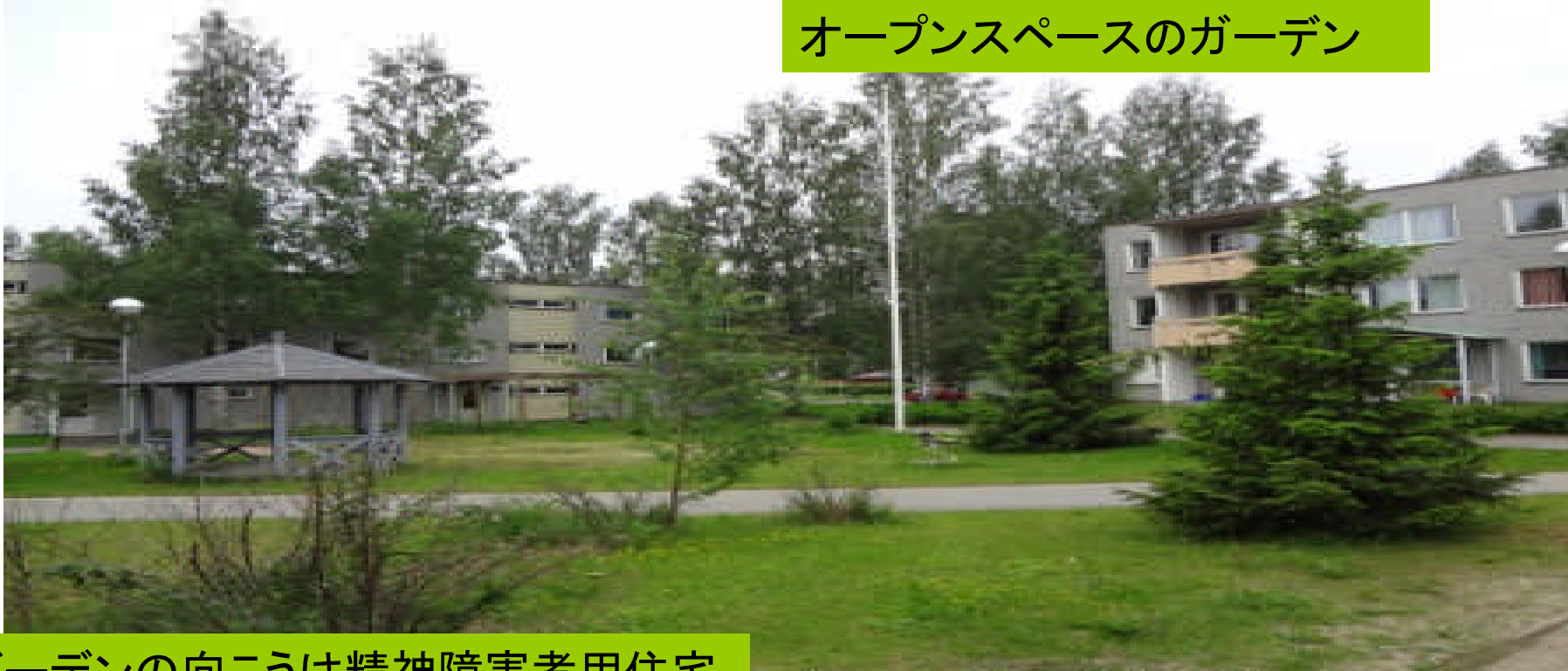
オープンスペースのガーデン