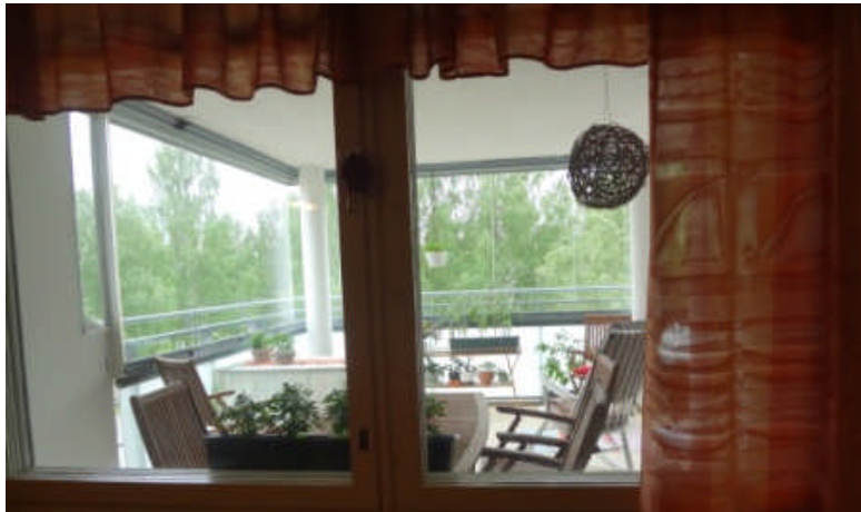
テラスが部屋の中からよく見える