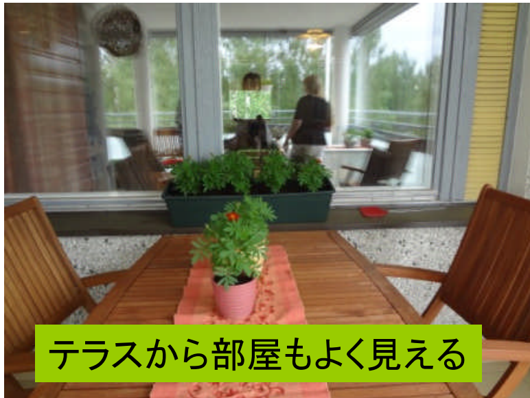
テラスから部屋もよく見える