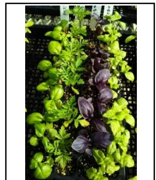
5/15 セルトレイ 施肥後2日目の様子