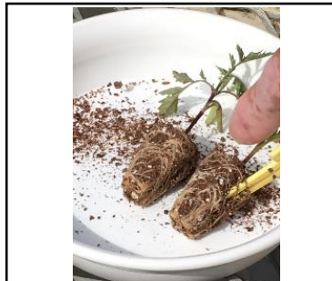
5/11 マリーゴールド 根は茶色で老化している