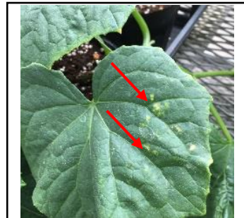
5/11 キュウリ アザミウマの吸汁による