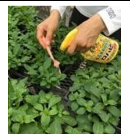
5/16 ペチュニア 葉の裏に薬剤(写真はロハピ)散布