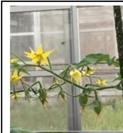
5/15 トマト全株 開花・結実を確認