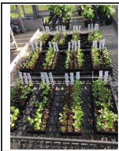
5/10 セルトレイ 全体の様子