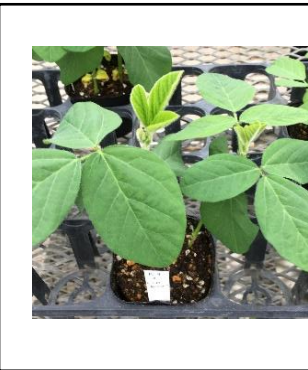
5/14 エダマメ施肥翌日 灌水後、葉が水平に戻る