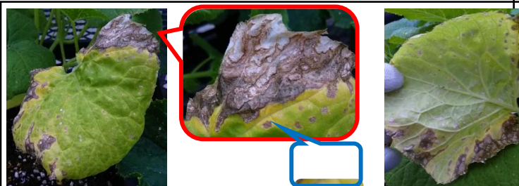
5/15 キュウリの斑は、葉脈に沿わない(×べと病)、白粉がない(×うどん粉病)、病斑に穴はない(×炭疽病)。葉が傷んだ所から灰色カビ病が拡大したが今は治まったか？