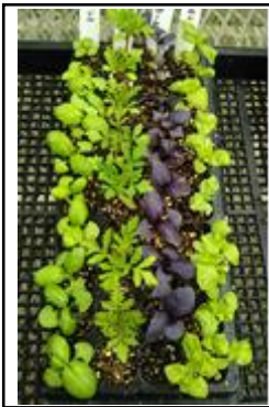
5/12 セルトレイ 施肥前日の様子